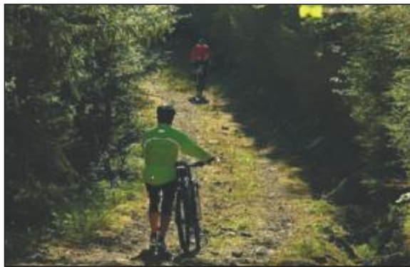
Bratt unna: Full fart på sykkel, eller roleg gange ned dei bratte bakkane.